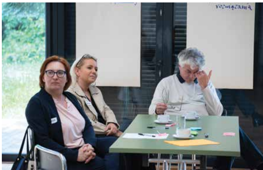
Pierwszy dzień narady to czas prezentacji i zdobywania wiedzy specjalistycznej.

Pierwszego dnia uczestnicy zobaczyli trzy prezentacje: „Zmiany