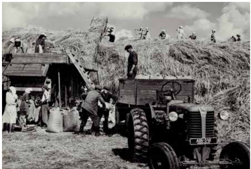
Żniwa w Regułach