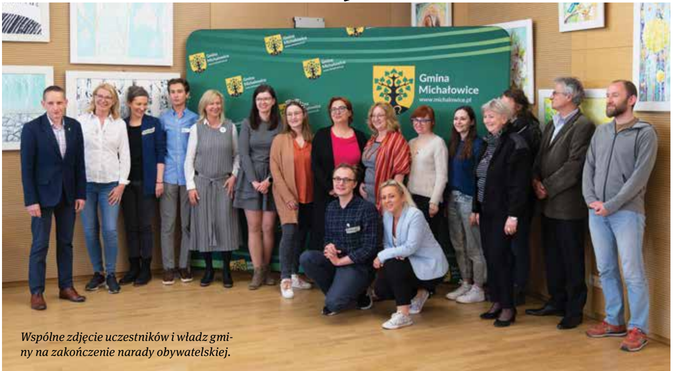
Wspólne zdjęcie uczestników i władz gminy na zakończenie narady obywatelskiej.