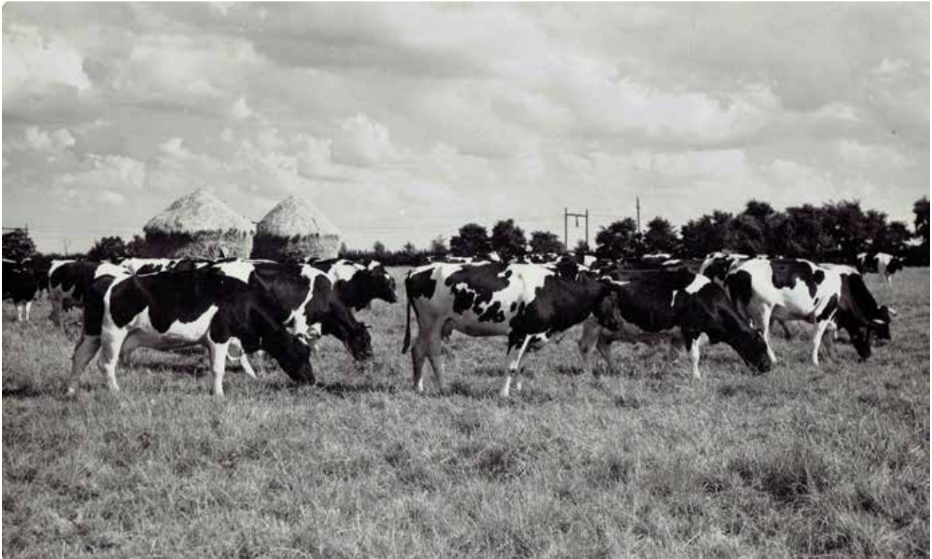
Wypas krów/żniwa, Reguły, połowa lat 50.

stra pamięta, iż w Zabierzowie regularnie przygotowywano paczki do oflagów na podstawie otrzymywanych list z nazwiskami oficerów.