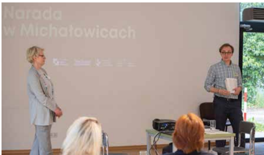
Narada obywatelska rozpoczęła się w świetlicy w Regulach

Pod koniec maja odbyła się w gminie Obywatelska Narada o Klimacie. Narada przeprowadzona została przez Fundację Pole Dialogu i Instytut na rzecz Ekorozwoju. W projekcie biorą z nami udział 3 inne gminy – Cieszyń, Lesko i Świdwin.