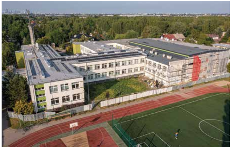
Szkoła w Michałowicach - widać panele fotowoltaiczne na dachu. Nowa sala gimnastyczna ma już dach i trwa ocieplenie jej ścian.