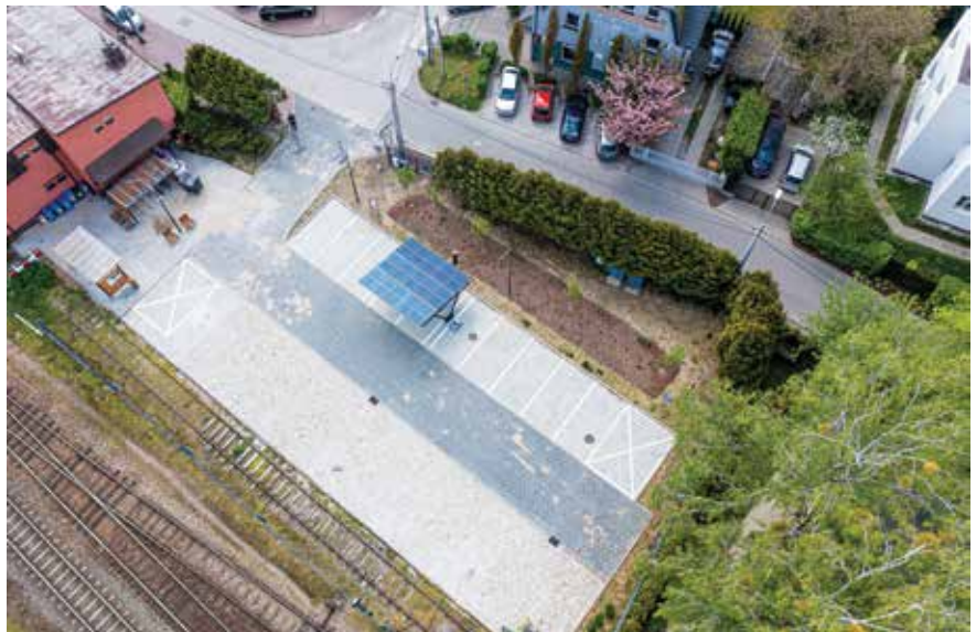
Parking P+R w Komorowie przy ulicy Ceglanej

znalazły się ogromne wymienniki służące do pobierania ciepła z otoczenia, które później wtłaczane jest do wnętrza szkoły. Takie rozwiązanie pozwala zmniejszyć kilkukrotnie koszty związane z ogrzewaniem budynku. Urządzenia zostały uruchomione w zeszłym roku, więc działały już sprawnie przez zimowy sezon grzewczy. Docieplenie ścian budynków szkoły zostało zakończone, pozostała jeszcze do wykonania elewacja sali gimnastycznej. Na dachu zainstalowano panele fotowoltaiczne, które pozwolą zmniejszyć koszty zakupu