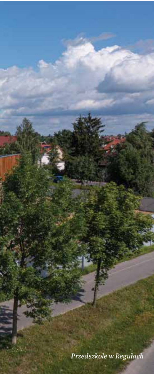
Przedszkole w Regułach