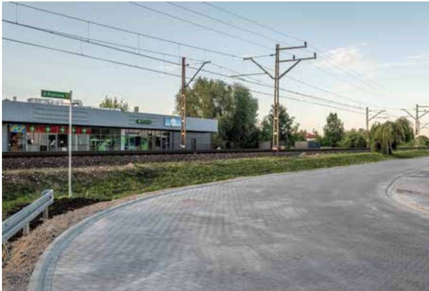
Ulica Przytorowa w Reguły

Oprócz budowy świetlicy zostanie wykonany I etap zagospodarowania terenu. Obejme on m.in. utworzenie placu zabaw, którego nawierzchnia zostanie wykonana z bezpiecznych materiałów. Urządzenia zabawowe zostaną przeniesione z obecnej lokalizacji.