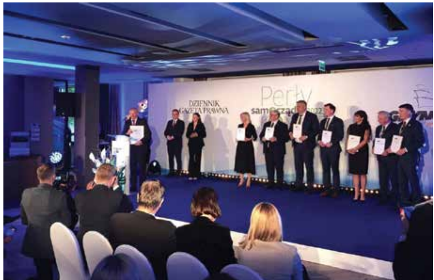
Gala wręczenia nagród „Perły Samorządu”

Gminy oceniano wg 7 wskaźników ich kondycji finansowej: udziału dochodów własnych w dochodach ogółem JST, relacji nadwyżki operacyjnej do dochodów ogółem, udział wydatków inwestycyjnych w wydatkach ogółem, obciążenia wydatków bieżących wydatkami na wynagrodzenia i pochodne, udziału środków europejskich w wydatkach, relacji zobowiązań do dochodów oraz udziału podatku dochodowego od osób fizycznych.