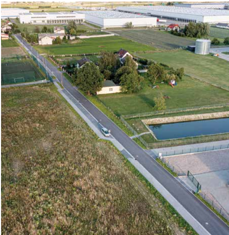
Ulica Wspólnoty Wiejskiej w Sokółowie