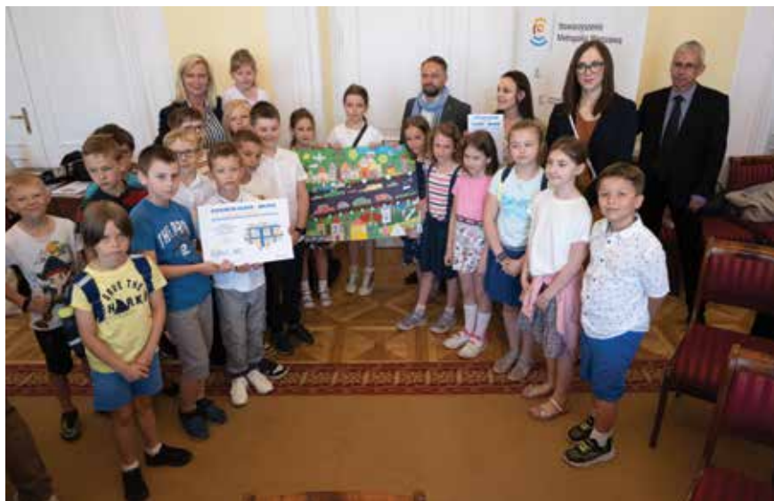
Uczniowie IIC na wręczeniu nagród w warszawskim Ratuszu

Konkurs zorganizowany był przez miasto stołeczne Warszawę oraz Stowarzyszenie Metropolia Warszawa dla klas 1-3 szkół podstawowych. Dzieci wraz z nauczycielem miały za zadanie przygotować plakat ilustrujący, jak bardzo zmieniło się ich najbliższe otoczenie w ciągu 18-letniej obecności w Unii Europejskiej. Uczniowie mieli wskazać korzystne zmiany, jakie zaszły w miejscu ich zamieszkania dzięki projektom dofinansowywanym ze środków Unii Europejskiej, prezentując działania proinijne w ich okolicy, pokazując jak bardzo cieszą się z bycia Europejczykiem.