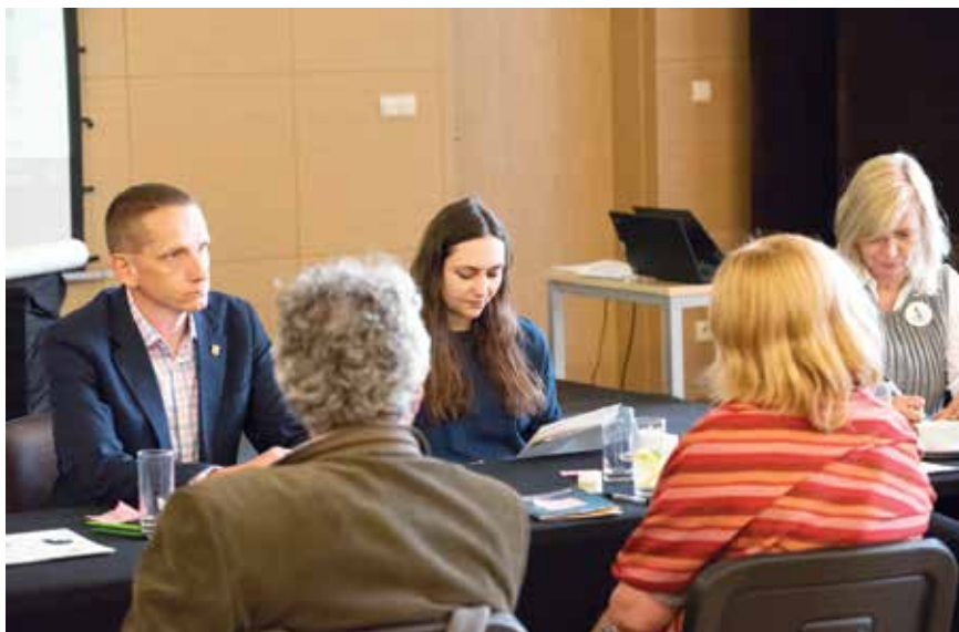
Rekomendacje wypracowane w toku narady obywatelskiej zostały przedstawione ostatniego dnia władzom gminy.