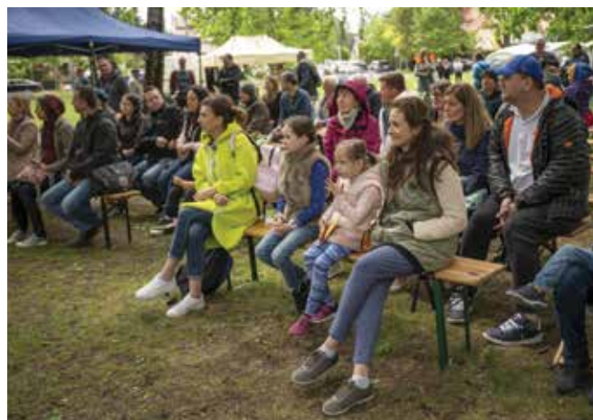
21 maja na placu Ignacego Jana Paderewskiego w Komorowie królowały wielobarwne motyle.