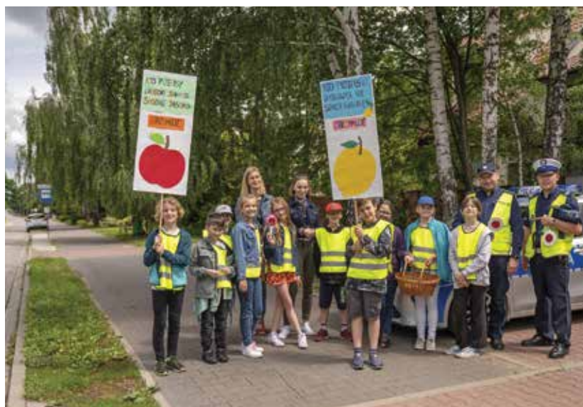
Dzieci trzymały dwa transparenty z napisami: „Kto przepisów drogowych nie szanuje, kwaśną cytrynę otrzymuje” oraz „Kto przepisy drogowe szanuje, słodkie jabłko otrzymuje”