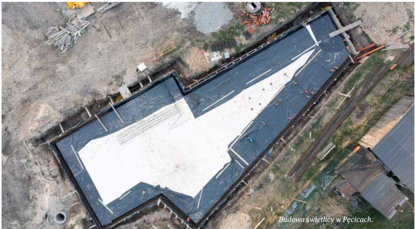
Budowa świetlicy w Pęcicach.

ulicy Wspólnoty Wiejskiej w Sokołowie, dzięki której mieszkańcy otrzymają wygodny dojazd do orlika i świetlicy wiejskiej.