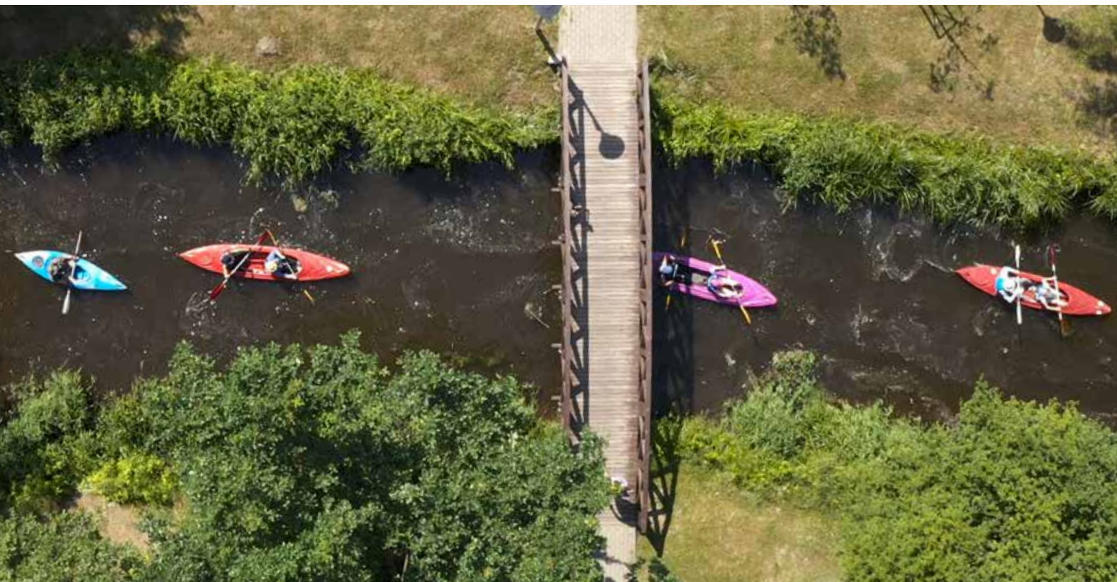
Konferencja zakończyła się sesją plenerową, w ramach której odbył się kajakowy spływ rzeką Utratą od zalewu do jazu w Pęcicach.

https://www.youtube.com/user/GminaMichalowice/videos